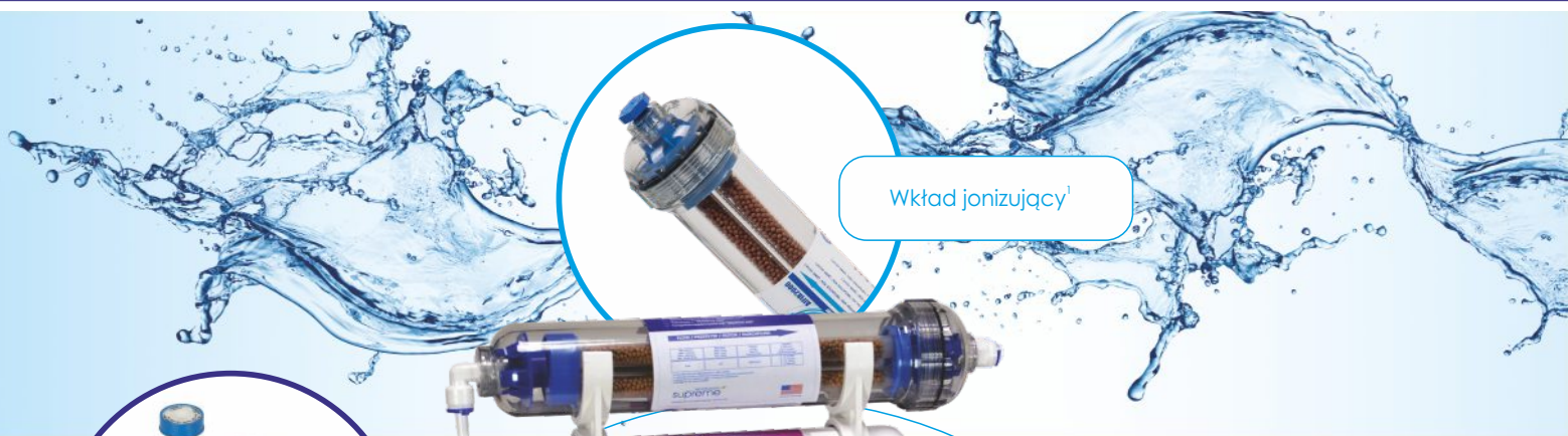
Wkład jonizujący 1