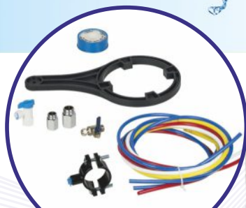
Akcesoria do prawidłowej instalacji