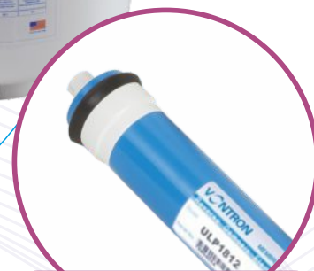
Wysokowydajna membrana RO 75 GPD (280l/24h)