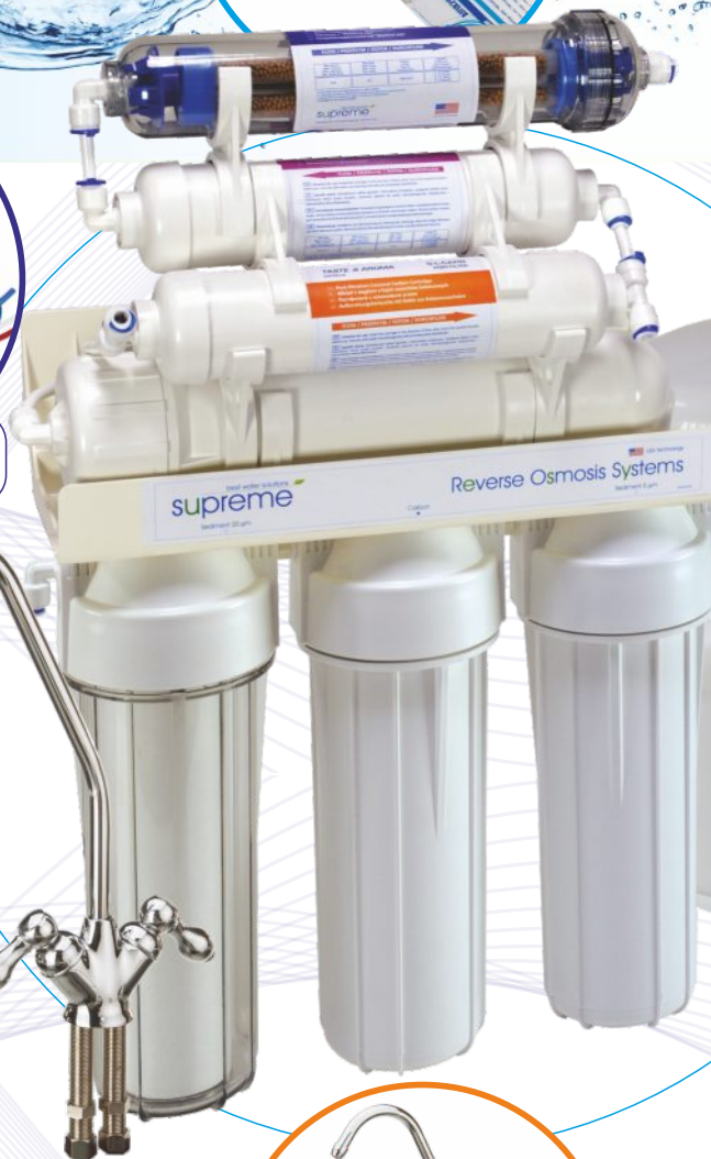
Wkład mineralizujący 2